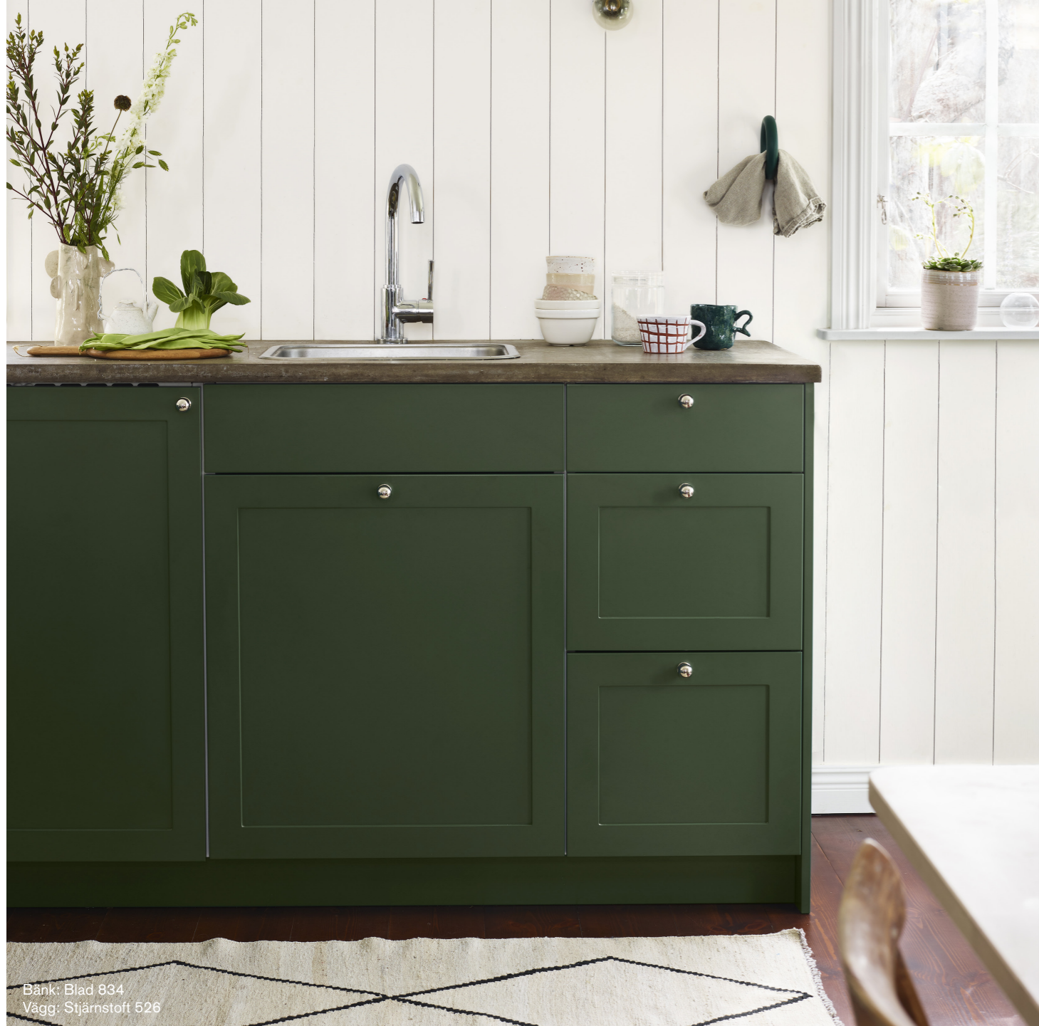
Bänk: Blad 834 Vägg: Stjärnstoff 526

Är du sugen på en förändring, men utan att behöva flytta eller renovera? Då är det enklaste knepet att använda dig av färg och kreativitet. En ny kulör eller en uppfräschning av en yta gör stor skillnad för intrycket. Och det behöver inte bara handla om att måla om väggarna. Kanske räcker det att måla köksluckorna i en ny kulör? Eller varför inte sätta färg på golv, tak eller en möbel.