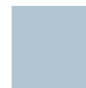
Midsommarmatt 756 / 1908-B