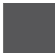
Åska 517 S 7000-N