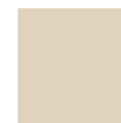
Papier-maché 843 1606-Y32R