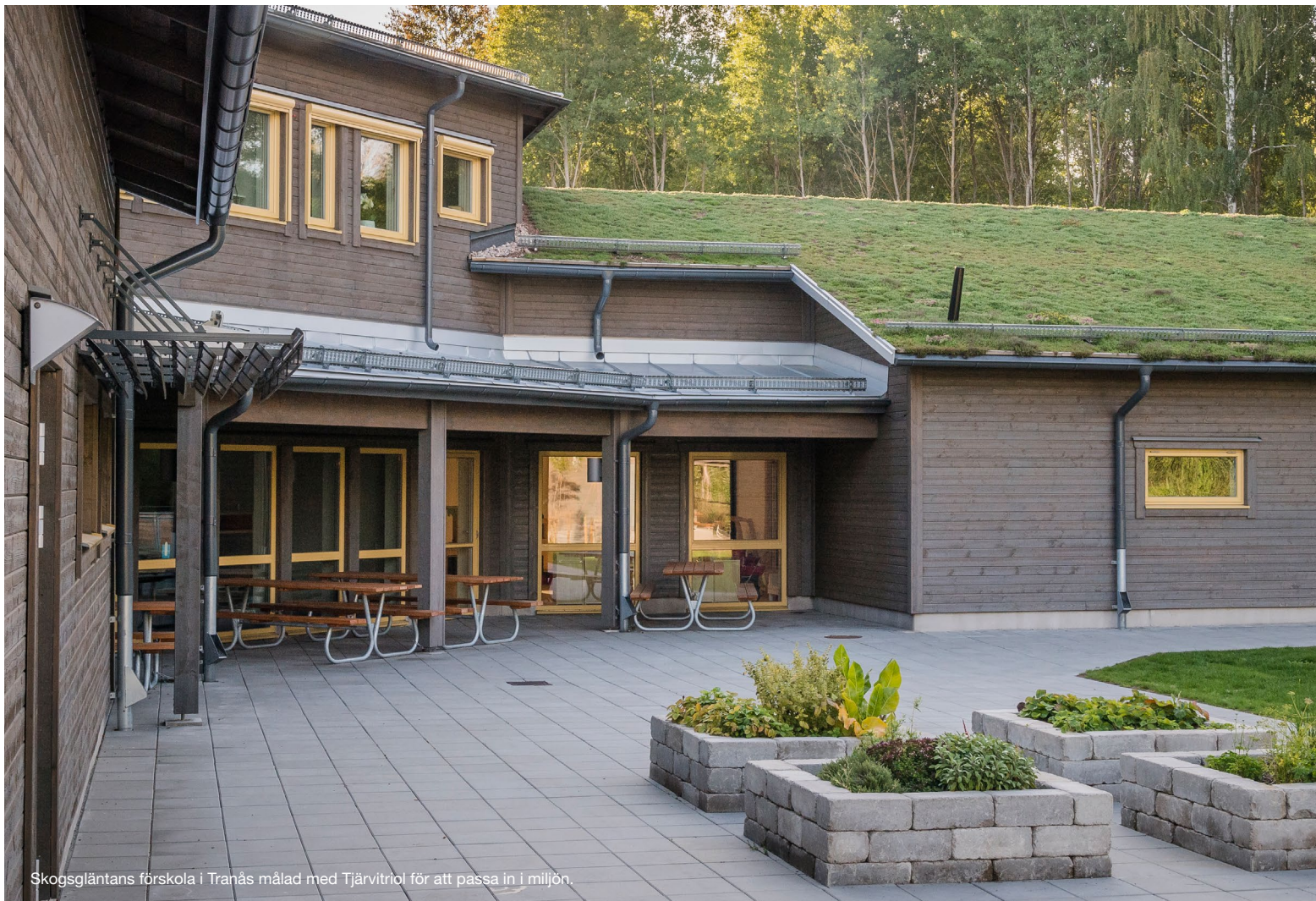
Skogsgläntans förskola i Tranås målad med Tjårvitriol för att passa in i miljön.