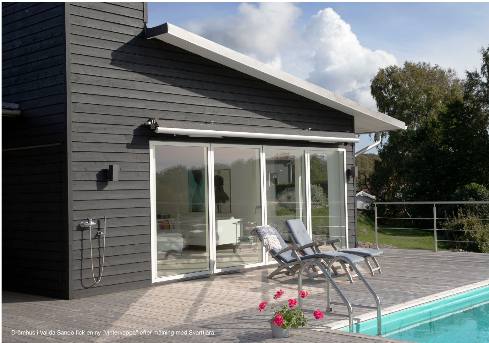
Drömhus i Vallda Sandö fick en ny "vinterkappa" efter målning med Svarttjära.