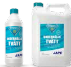
Volym: 1 liter 5 liter Art.nr. 13812 13824

1 liter Mögel-Fri brukslösning (spädes ej) räcker till ca 5 m 2 .