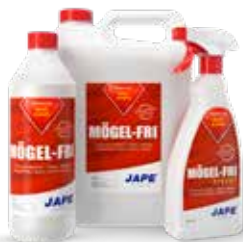
Volym: 1 liter 5 liter 0,5 liter Art.nr. 11812 11824 11811

1 flaska Grön-Fri Direkt räcker till ca 2,5 m 2 (spädes ej)