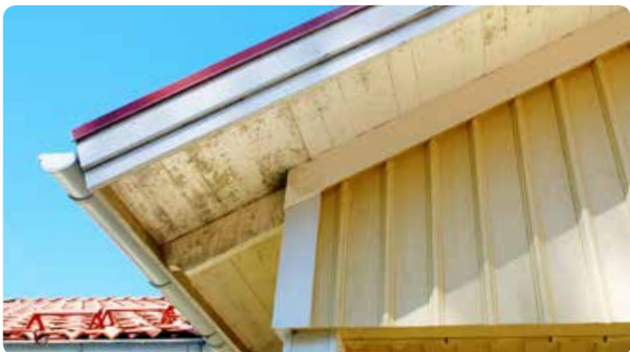
Underslag med angrepp av mögel. Täckmålat trä.