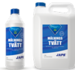
Volym: 1 liter 5 liter Art.nr. 13912 13924

1 del Underhållstvätt spädes med 20 delar vatten. 1 liter brukslösning räcker upp till 15 m 2 .