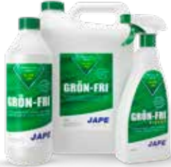
Volym: 1 liter 5 liter 0,5 liter Art.nr. 13012 13024 13011

En serie effektiva desinfektions- och rengöringsmedel från Jape. Väljer du dessa produkter får du ett heltäckande system för underhåll av fasader och andra ytor. Samtliga produkter är biologiskt nedbrytbara.