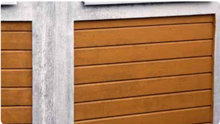
Vitmålade knutbrädor och liggande träpanel med angrepp av mögel.