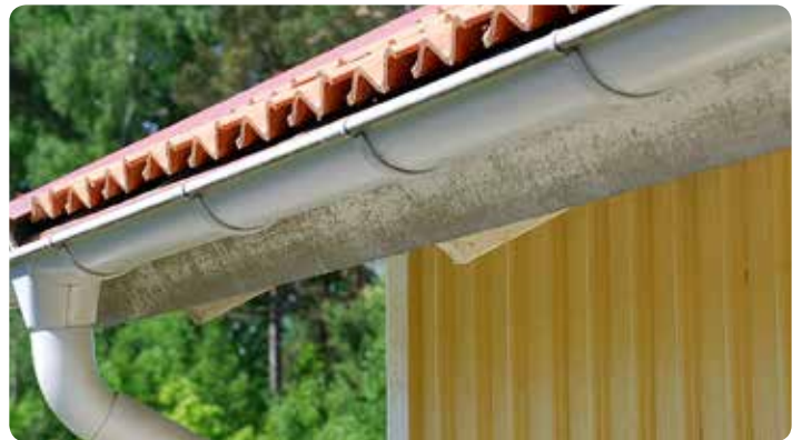
Takfotsbräda med angrepp av svarta prickar av mögel.