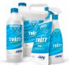
Volym: 1 liter 5 liter Tvättduk 0,5 liter Art.nr. 14212 14224 14200 14211

1 del Målningstvätt spädes med 20 delar vatten. 1 liter brukslösning räcker upp till 15 m 2 .