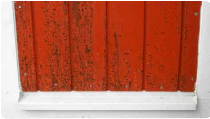
Fasad målad med Falu rödfärg. Missfärgad av mögel.