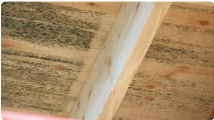
Omålat takutsprång med svarta prickar av mögel.