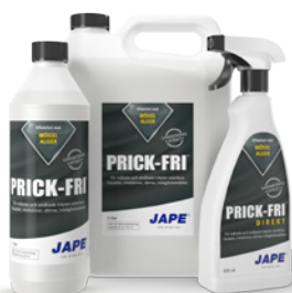
1 liter 5 liter 0,5 liter

1 flaska Grön-Fri Direkt räcker till ca 2,5 m 2 (spädes ej)