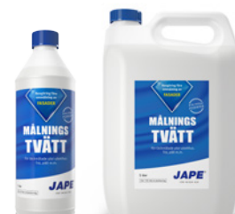
1 liter 5 liter

1 del Underhållstvätt spädes med 20 delar vatten. 1 liter brukslösning räcker upp till 15 m 2 .