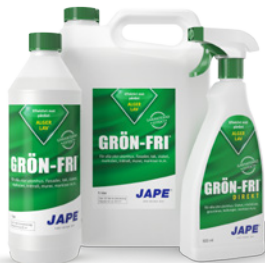
1 liter 5 liter 0,5 liter