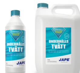
1 liter 5 liter

1 liter Prick-Fri utspädd till 5 liter brukslösning räcker till ca 25 m 2 .