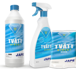
1 liter 0,5 liter Tvättduk

1 del Målningstvätt spädes med 20 delar vatten. 1 liter brukslösning räcker upp till 15 m 2 .